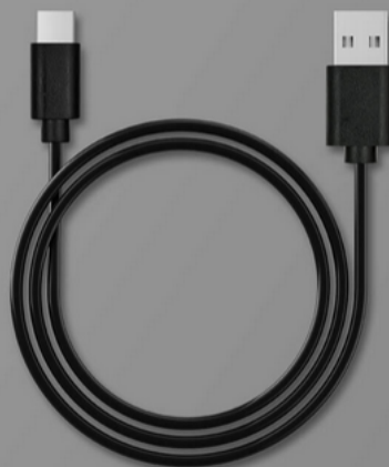
USB Power Cable Type-C to Type-A (1 m)