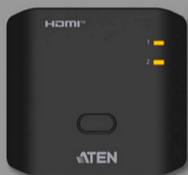
2-Port True 4K HDMI Splitter